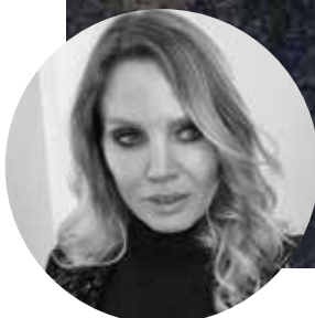
PRODUCTIE Ginette Tellier